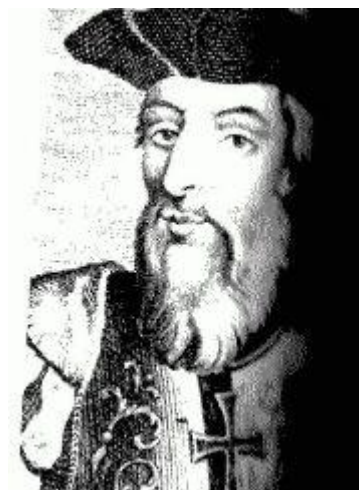
Vasco da Gama

Vasco da Gama (ok. 1460-1524), żeglarz portugalski, odkrywca drogi morskiej do Indii. W wyprawie 1497-99 opłynął Przylądek Dobrej Nadziei i dotarł do Kalikatu w Indiach. Podczas wyprawy 1502-03 założył faktorie portugalskie w Mozambiku i Indiach oraz zwalczał handel arabski na Oceanie Indyjskim. W 1524 został wysłany jako wicekról ponownie do Indii, gdzie wkrótce zmarł. Wyprawy da Gamy otworzyły drogę morską do Indii i pozwoliły Europie nawiązać bezpośrednie stosunki handlowe i kulturalne z krajami Azji Południowej przyczyniły się też do wzrostu potęgi kolonialnej Portugalii w XVI w.