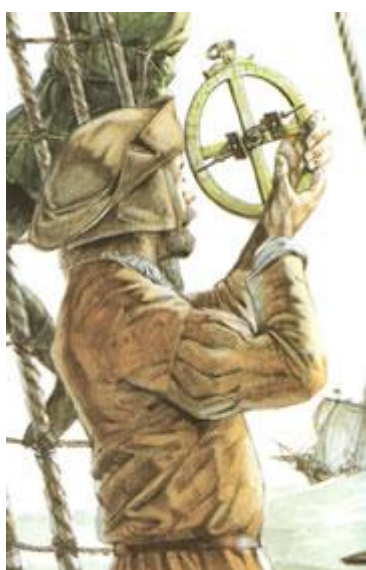
Nawigator ustalający położenie słońca na niebie za pomocą Astrolabium

Z czasem naukowcy średniowieczni udoskonalili technikę żeglarką. Przywrócono znajomość zapomnianej od czasów starożytnych siatki kartograficznej, która umożliwiała dokładniejszą orientację na morzu czy oceanie, jednak i tak najlepiej opracowany był obszar Morza Śródziemnego.