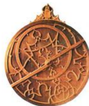
Astrolabium z 1572 roku, przyrząd nawigacyjny umożliwiający wyznaczenie położenia kontowego gwiazd

przybrzeżnej: kabotaż, chociaż i to nie ochraniało małych statków przed zatopieniem pod ciężarem wielkich fal oceanicznych. Właśnie głównie dlatego wymyślono nowy rodzaj statków. Od pierwszej połowy XV wieku w użycie weszły statki zwane karawelami. Pierwsze tego typu statki były stosunkowo niewielkie (około 15 metrów długości). Ich główną zaletą były ruchome liny, reje i żagle, dzięki czemu to żeglarze, a nie wiatr ustalali kierunek trasy. Były bardzo zwrotne i szybkie, co idealnie nadawało się do wypraw badawczych. Plusem była także ich praktyczność. Nie trzeba było zabierać już tylu ludzi, wystarczyło 50, w tym 14 osób załogi, dwóch kapłanów, a resztę tworzyło wojsko. Karawele w 2/3 mieściły w sobie żywność oraz wodę do picia. Aby wody wystarczało na dłużej mieszano ją z alkoholem, a zamiast chleba, który szybko czerstwieje, spożywano suchary. Mięso suszono, rozdrabniano na kawałki i pakowano.